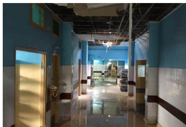
Neonatologia di Beira dopo il Ciclone Idai

La soluzione prospettata viene illustrata nelle elaborazioni grafiche che seguono: