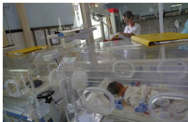
Neonatologia di Beira prima del Ciclone Idai